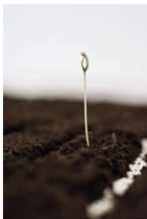
Fig. 2 : Chorus of soil , installation (2019), Détails : bourgeons de melons.