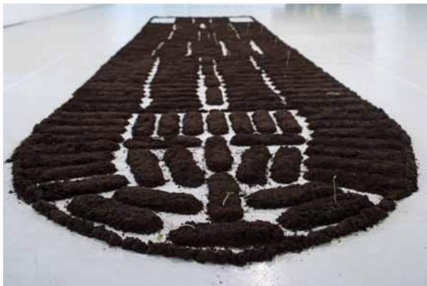
Fig. 1 : ŒUVRE COMPLETE/Chorus of soil , installation (2019), terre agricole, bourgeons de melons; 4 m x 2 m (Photo : Raissa Galofre, Germany. Courtesy of the artist).